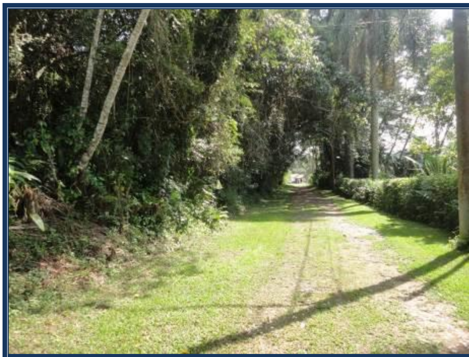
Vista da Estrada Nove que lhe dá acesso.