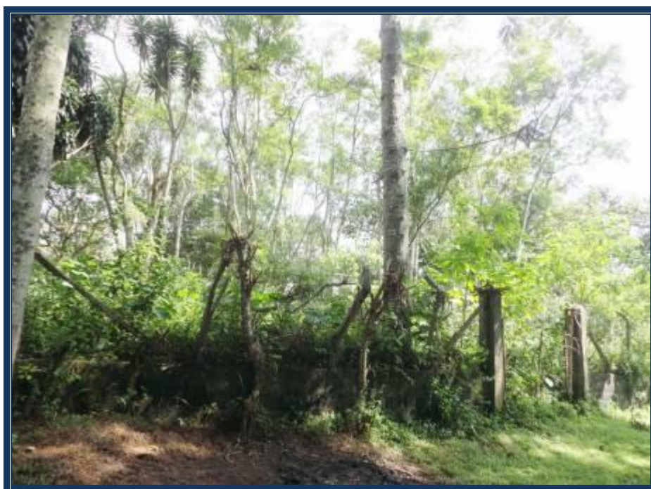
Vista da frente do imóvel avaliando.