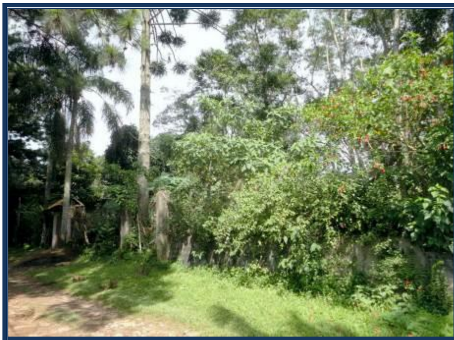
Vista da frente do imóvel avaliando.