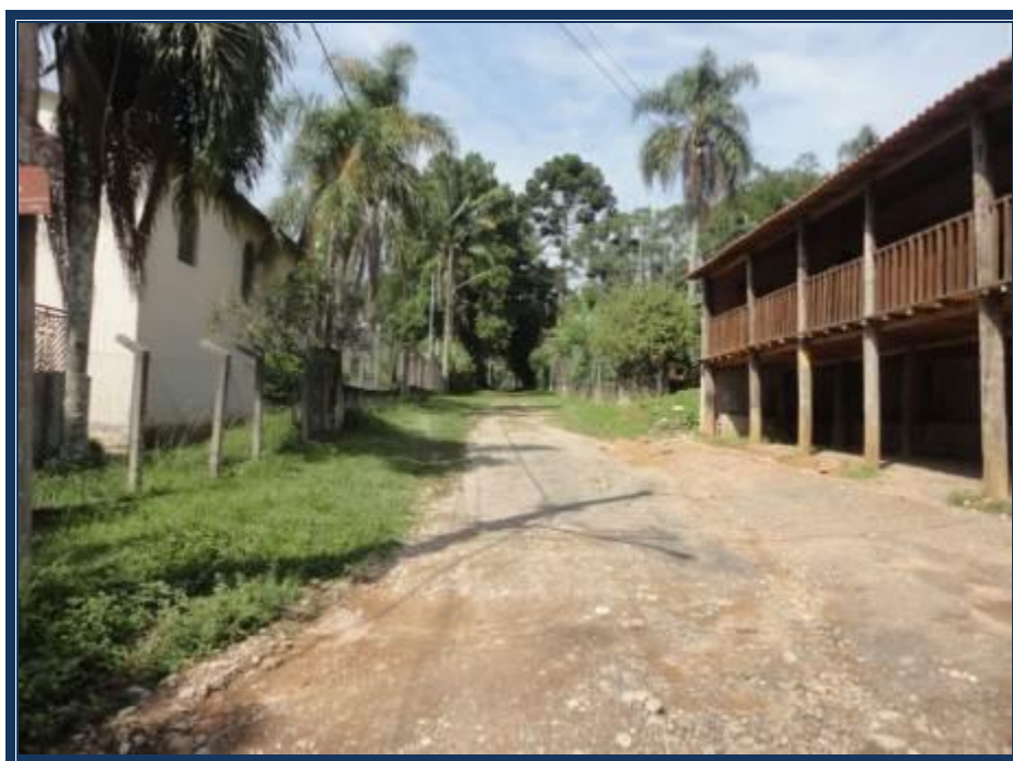
Vista da Estrada Nove que lhe dá acesso.