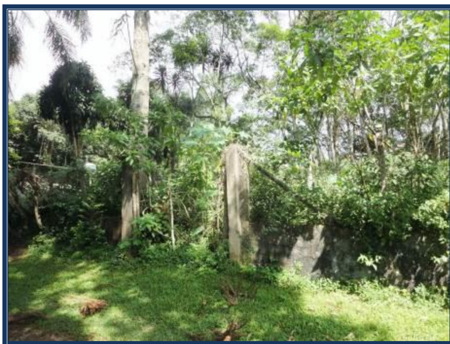
Vista da frente do imóvel avaliando.