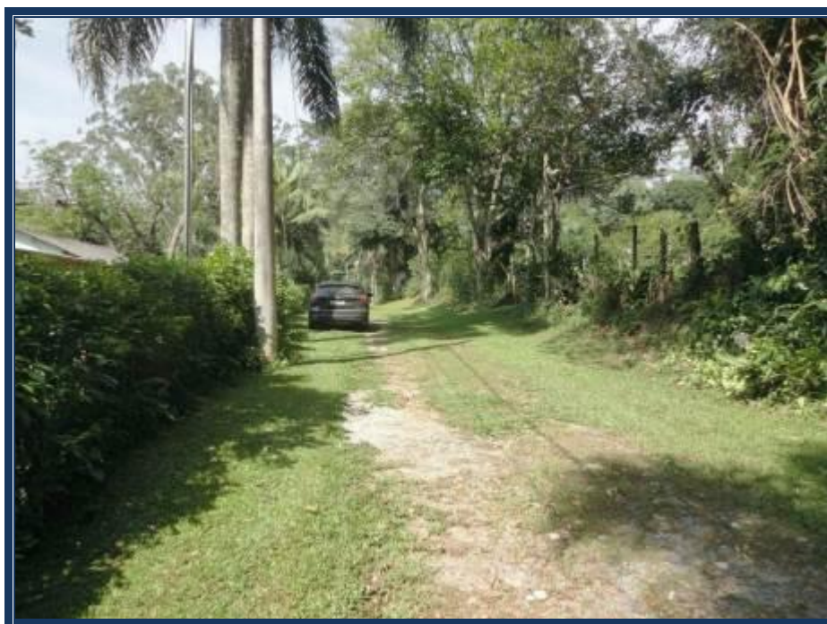
Vista da Estrada Nove que lhe dá acesso.